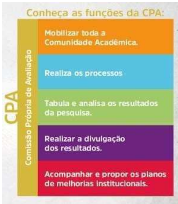
Figura 3 – Funções CPA