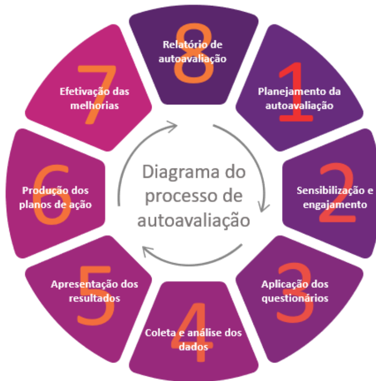
Figura 4 – Diagrama do Processo de Autoavaliação

O processo de autoavaliação do Centro Universitário Ritter dos Reis – UniRitter foi idealizado em oito etapas, previstas e planejadas para que seus objetivos possam ser alcançados, conforme explicitado a seguir.